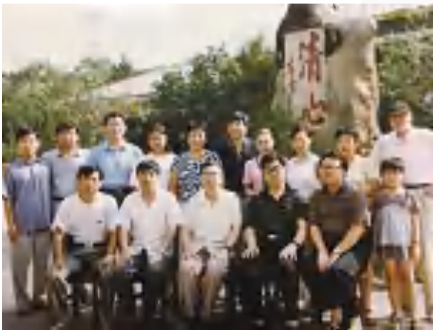
1997年，中国工程院副院长朱高峰与省局《奉献》创作组成员在镜泊湖合影

我原本想写完第二卷以后就不再继续了，但汤局长还坚持让我编下去。经过反复比较，最后确定了17个选题，其中有全国邮电系统劳动模范、先进集体，还有全国百优乡邮员以及优秀企业管理者、献身微波事业的基层干部、发挥余热的省局离休老干部等。我写出了详细的