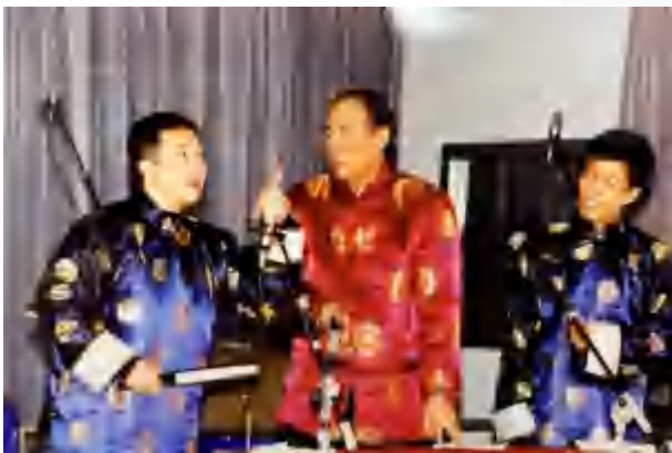
本文作者（中）在表演相声

哈电信局组建了“振兴中华”读书求知演讲团，成员以演出队为主。我们在基层讲，在市局讲，在邮电系统讲，市总工会还邀请我们到全市中小学校、企事业单位讲。演讲与文艺演出相结合，一时间誉满冰城。省邮电工会