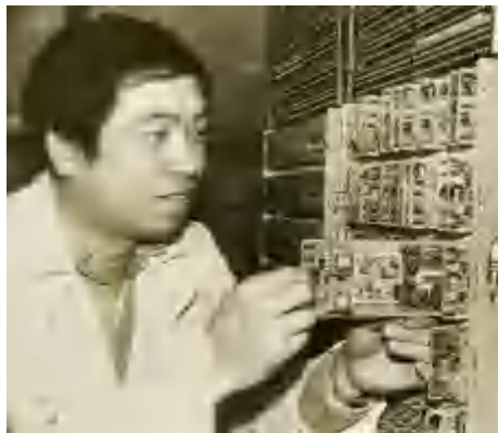
微波站的值守人员

从微波山站到家属区全是土道,冬天下大雪,夏天下大雨,非常难走,男职工一律坐敞篷车上,女职工坐驾驶楼里。冬天零下30多摄氏度,冻得实在挺不住了就下车跟着车跑一段路再上车。遇到雨雪天封道,职工要背着口粮和蔬菜徒步行走10华里山路接班。