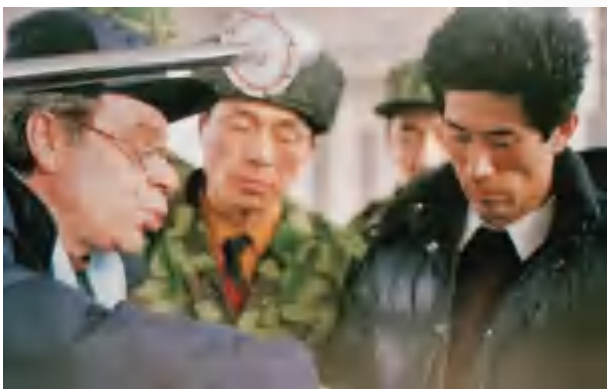
总站技术人员研究解决山站的技术问题

那时微波总站提出“通信生产是中心,企业管理是重点,群众生活是基础,领导班子是关键”的工作方针,我们每年秋季出车去北安、肇东等地买土豆拉粉条分给职工;冬季站里出车,帮助职工拉烧柴;严冬时每户送1车