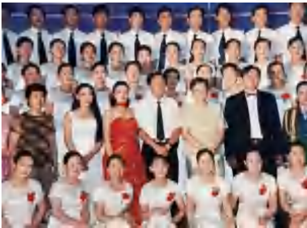
《邮递阳光》演出后合影，二排右三为本文作者

1999 年 9 月，全国邮政行业管理工作会议在哈尔滨召开，省局为大会举办了一场《邮递